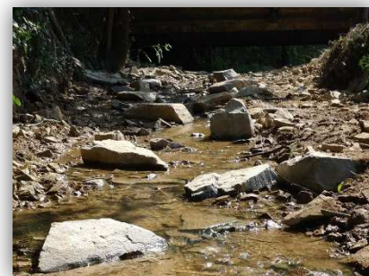
Réalisation d'une rampe d'enrochement sur le ruisseau de Coueilly - Guenrouet - SBVB