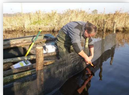
Installation de barrages-filtre anti jussie pour le Syndicat du Bassin Versant du Brivet