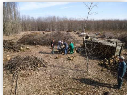
Coupe d'une châtaigneraie pour la communauté religieuse de Saint-Gildas-des-Bois