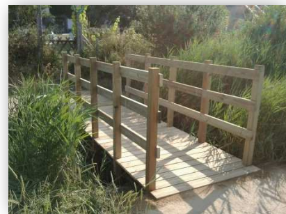
Fabrication et pose d'une passerelle en bois - Mesquer