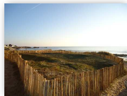
Aménagement du littoral avec pose de govelles - Plage de la govelles à Batz sur Mer